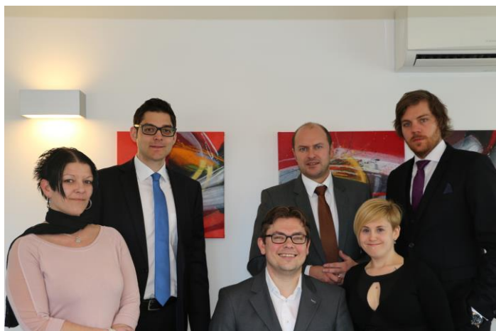
.Dax & Partner