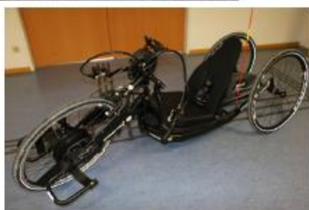
E - Handbike