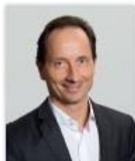
Präsident Stv. LAbg. Günter Kovacs